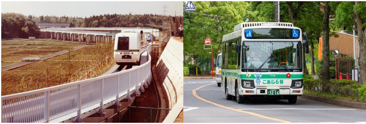
写真左：運行開始当初の「こあら号」 写真右：路線バス「こあらバス」

山万ユーカリが丘線は、運行開始からこれまで 40 年間無事故を継続しており、ユーカリが丘交通網の主幹を担いながら、一貫して地域住民の生活の足として愛され続けています。その間、ホームの段差解消、誘導・警告ブロックの整備等を通じたバリアフリー化はもちろん、大規模な橋脚の補修工事に着手するなど、常に安心・安全な交通システムとして定着してまいりました。近年では、顔認証システムによるチケットレス乗降車「顔パス決済乗車」、山万ユーカリが丘線を補完して高齢者や子育て世代の外出を支援する路線バス「こあらバス」と連動して移動手段をシームレスで提供するなど、MaaSの実現に向けて、常に時代と地域のニーズを常に取り入れながら、地域の皆様とともに成長し歩んでまいりました。