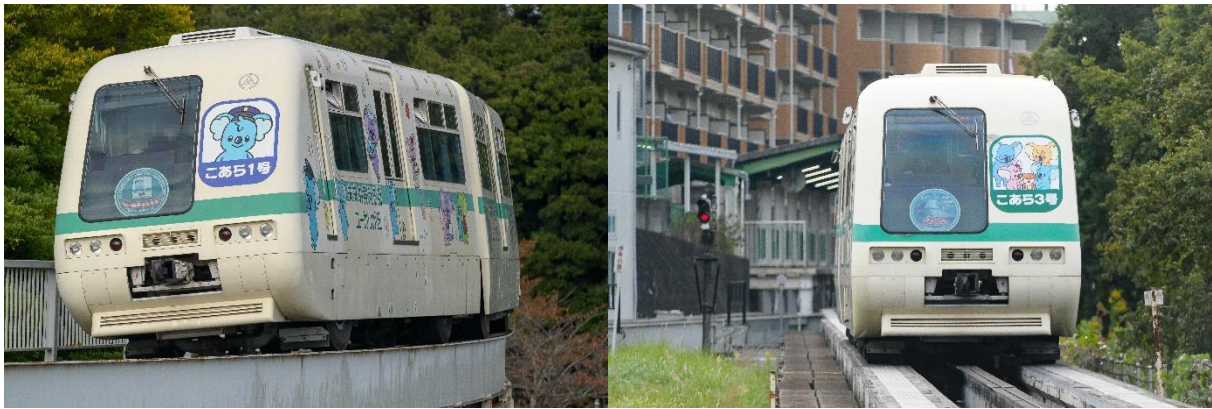
写真：40周年記念ヘッドマークを掲出する「こあら号」

山万ユーカリが丘線は、山万株式会社が開発を手掛けるユーカリが丘において、全ての住居から最寄り駅までが徒歩10分圏内に住まう生活を実現するため、民間企業経営の鉄道事業としては戦後初の鉄道事業許可を受け、山万株式会社鉄道事業部が事業を開始いたしました。約250haあるユーカリが丘ニュータウンの中心部をテニスラケット型に周回する山万ユーカリが丘線は、運行当初から騒音、振動、排気ガスを生じない環境に配慮した持続可能な新交通システムとして、ユーカリが丘のシンボルとなっております。