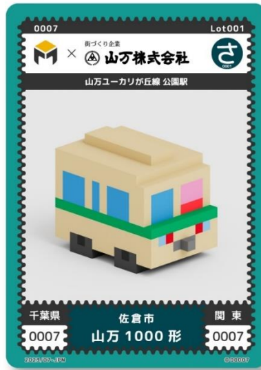
写真：ボクセルアートコレクションカード「metaca」山万限定デザイン