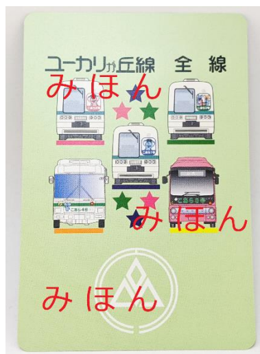
写真：山万ユーカリが丘線一日乗車券(みほん)

「metaca」は山万株式会社のSNS公式アカウント、山万ユーカリが丘線のInstgaram(@yukarigaoka_line)とTwitter (@life_in_yukari) のいずれかまたは両方をフォローしていただき、フォローしたことが確認できる画面を駅員に提示で1枚配布いたします。