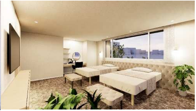
▲1階主寝室（約20.6畳）イメージ