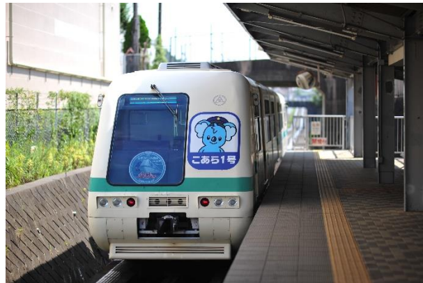
写真：40周年記念ヘッドマークを掲出する「こあら号」

山万ユーカリが丘線は、運行開始からこれまで40年間無事故を継続しており、ユーカリが丘交通網の主幹を担いながら、一貫して地域住民の生活の足として愛され続けています。近年では、顔認証システムによるチケットレス乗降車「顔パス決済乗車」実証実験を2021年8月から2023年3月まで実施いたしました。また、山万ユーカリが丘線を補完して高齢者や子育て世代の外出を支援する路線バス「こあらバス」と連動して移動手段をシームレスで提供するなど、MaaSの実現に向けて、常に時代と地域のニーズを常に取り入れながら、地域の皆様とともに成長し歩んでまいりました。