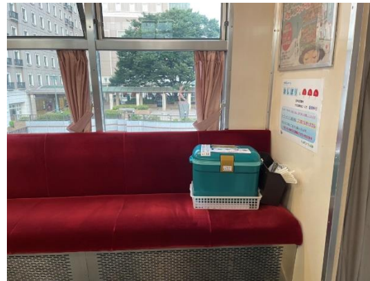
写真左：おしぼりヘッドマークを掲出した「おしぼり列車」 写真右：列車内に設置された「冷たいおしぼり」とうちわ