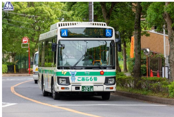
写真左：運行開始当初の「こあら号」 写真右：路線バス「こあらバス」

一方で、開業当初はまだ冷房車が一般的でなかった時代背景や、車両構造上やトンネル断面の制約上冷房装置の設置が困難といった理由から、山万ユーカリが丘線の車両は非冷房で運行しております。そういった中で、ご利用のお客様に少しでも暑さをしのいでいただこうと、列車内または駅構内にて「冷たいおしぼり」と、うちわをお配りするサービスを夏季期間中に実施しております。また、それにあわせて、専用ヘッドマークを掲出した「おしぼり列車」も運行しております。近頃は、こちらのサービスにつきまして、各種メディアにて取り上げていただくなど、山万ユーカリが丘線の夏の名物となっております。