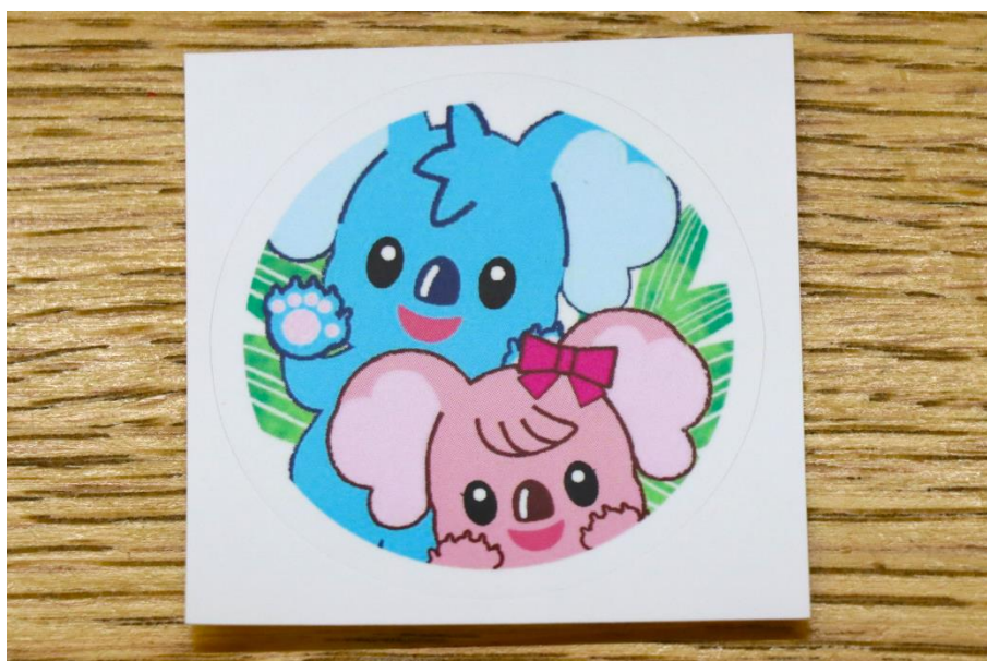
写真：ココ&ララオリジナルステッカー