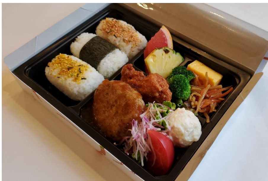
写真：オリジナル駅弁の中身